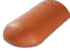
Sonlama Mahya (Oval) Mahya hattının sonunda kullanılır