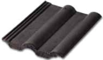
403 Parlak Siyah