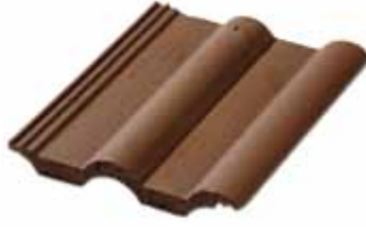
305 Mat Kahve