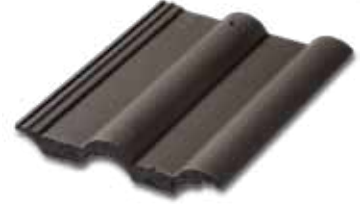
303 Mat Siyah