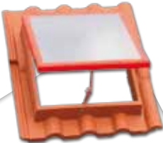
Çatı Çıkış Kapağı (Pencere açıklığı: 47X43 cm) Dört kiremit büyüklüğündedir. Havalandırma, aydınlatma ve çatıya çıkış amaçlı kullanılır.