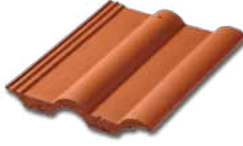
301 Mat Kırmızı