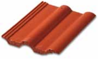
401 Parlak Kırmızı