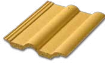
402 Parlak Sarı