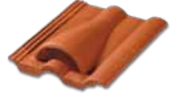
Havalandırma Kiremiti Kiremit altında hava sirkülasyonu yaratarak çatı ortamının sürekli kuru kalmasını sağlar.