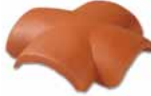
Dört Yollu Mahya Mahya hatlarının birleşim noktalarında kullanılır.