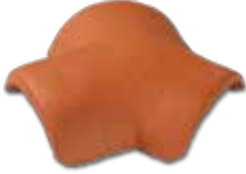
Üç Yollu Mahya Mahya hatlarının birleşim noktalarında kullanılır.