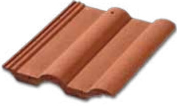
201 Kırmızı Naturel