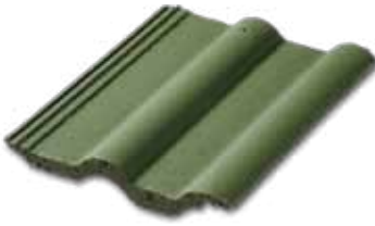
304 Mat Yeşil