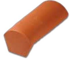
Sonlama Mahya (Köşeli) Yan kiremitlerin birleştiği noktada kullanılan estetik bir çözümdür