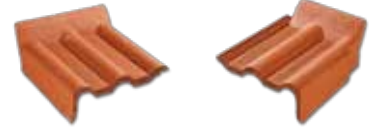
Sol Yan Duvar Dayama Kiremiti Sağ Yan Duvar Dayama Kiremiti