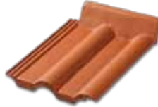
Duvar Dayama Kiremiti Duvar ile kiremit birleşim yerlerinde çinko gibi farklı malzeme kullanımından kaynaklanacak sorunlara son verir.