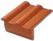
Arka Saçak Kiremiti

Duvar ile kiremit birleşim yerlerinde çinko gibi farklı malzeme kullanımından kaynaklanacak sorunlara son verir.