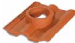
Direk Çıkış Kiremiti Ø 125 - Ø 70