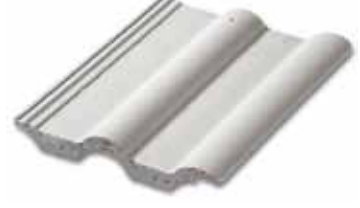
306 Mat Gri