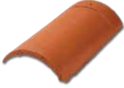
Mahya (Sarıyat 2,5 adet/m) Çatınızın mahya hattının örtülmesi için kullanılır.