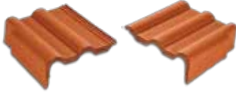
Sol Yan Kiremit Sağ Yan Kiremit Yan saçaklarda ve güvercinlik alınlarında kullanılarak çinko vb. malzeme kullanımından kaynaklanacak sorunlara son verir.