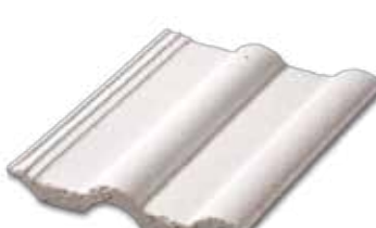
407 Parlak Beyaz